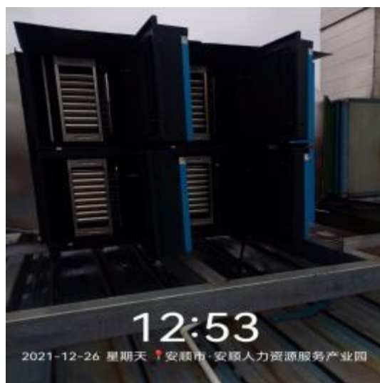
净化器机箱清洗前