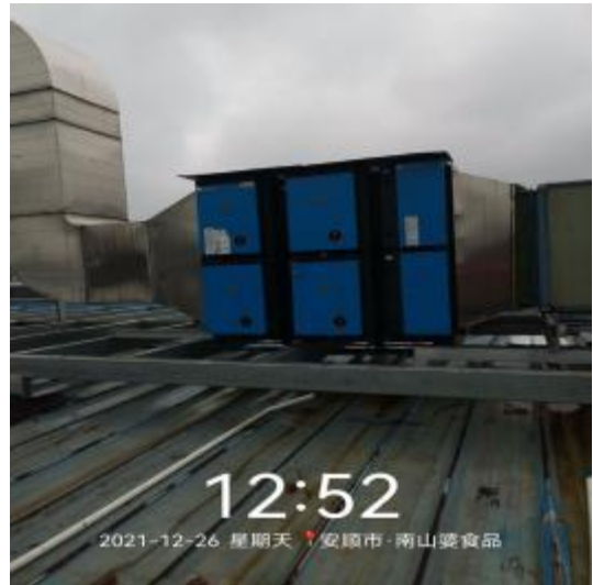
净化器机箱施工前