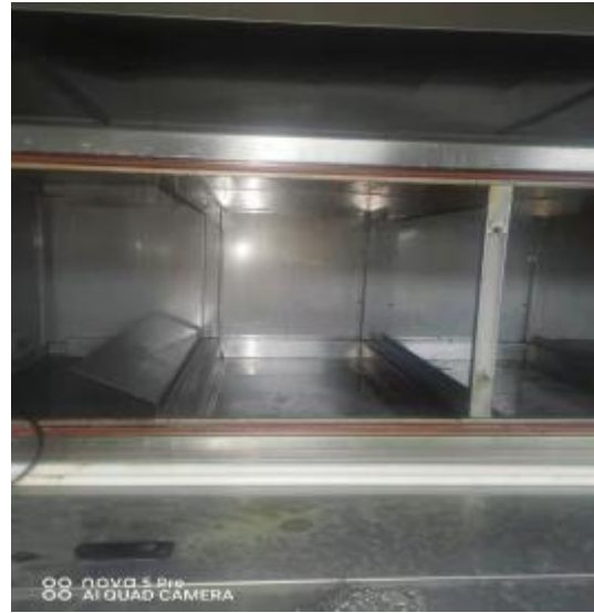
净化器机箱清洗后