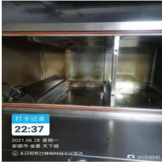
净化器机箱道清洗前