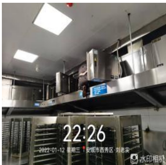
净化器机箱清施工中