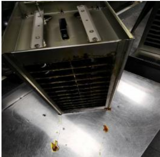
净化器机箱道清洗前 1