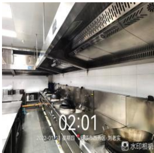
烟罩整体烟罩清洗后