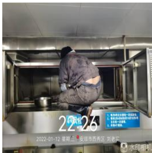
净化器机箱施工中