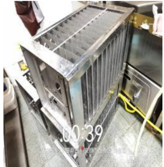
净化器机箱清洗后 1