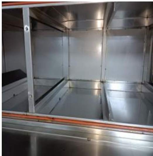
净化器机箱清洗后 2