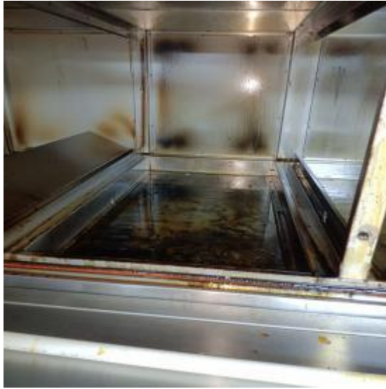
净化器机箱道清洗前 1