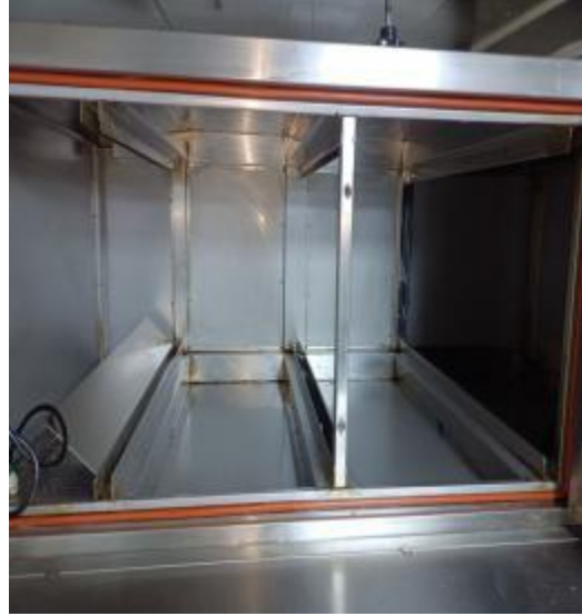
净化器机箱清洗后 1