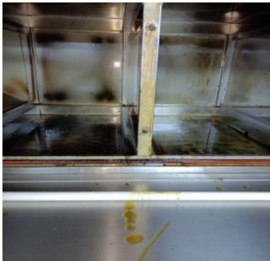
净化器机箱清洗前 2