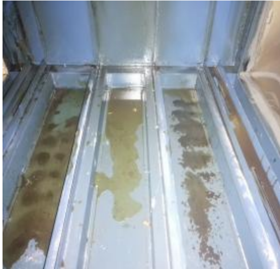
净化器机箱清洗前