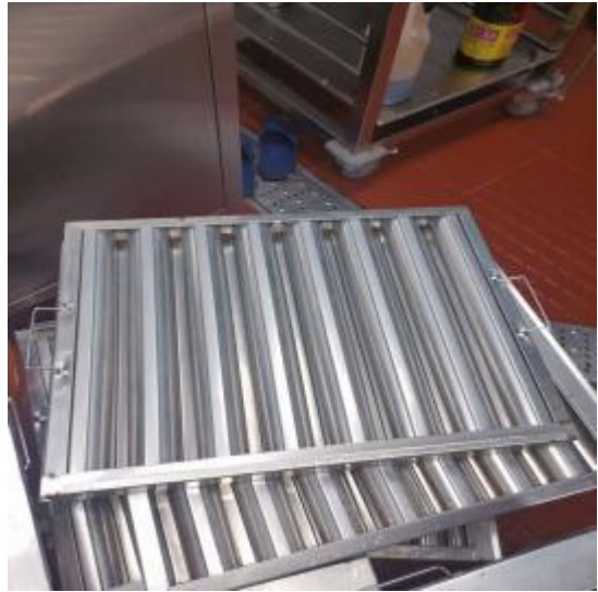
中厨防火板房清洗后