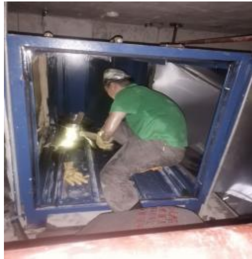
净化器机箱清洗中