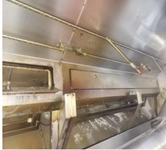
中厨房烟罩清洗前