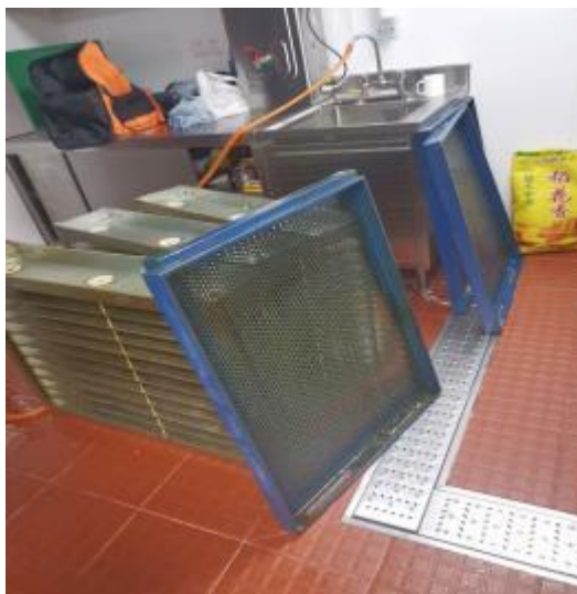
净化器清洗清洗中