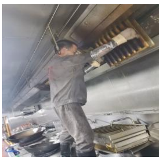
中厨房烟罩施工中