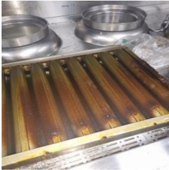
中厨房防火板清洗前