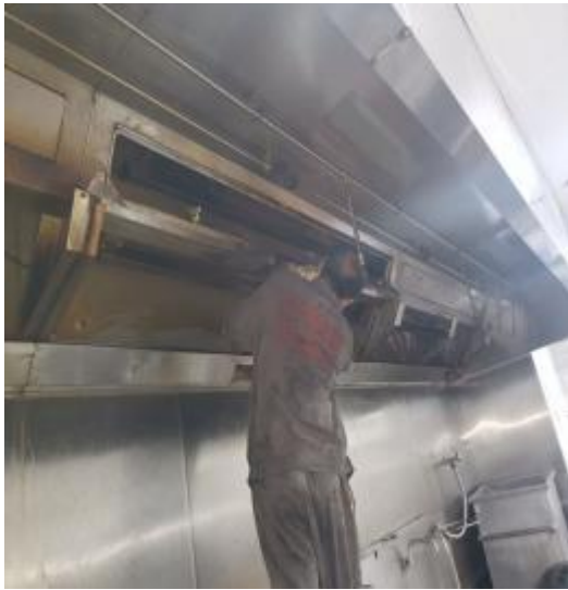
中厨房烟罩施工中