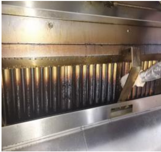
中厨房烟罩清洗前