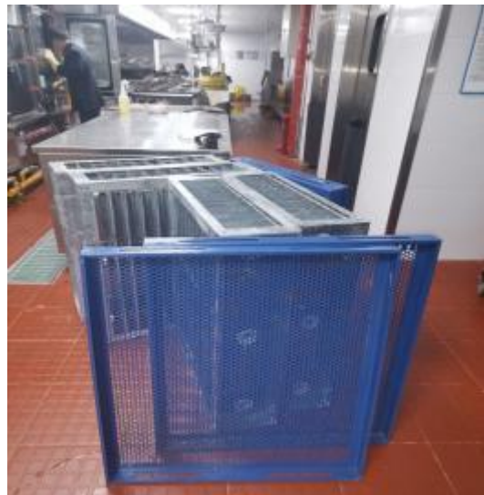
净化器清洗清洗中