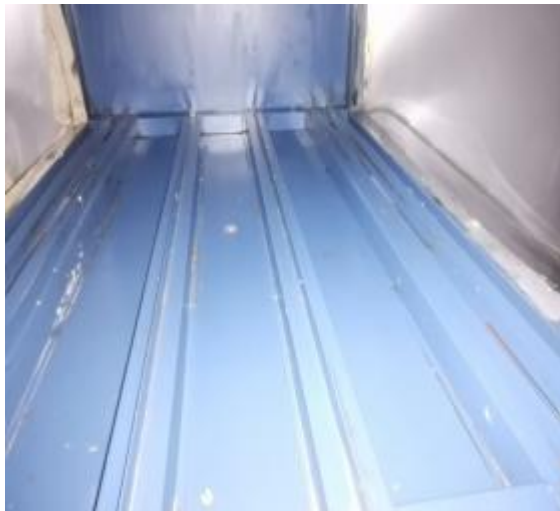
净化器机箱清洗后