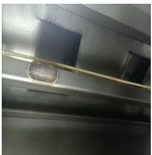
烧腊房烟罩清洗前