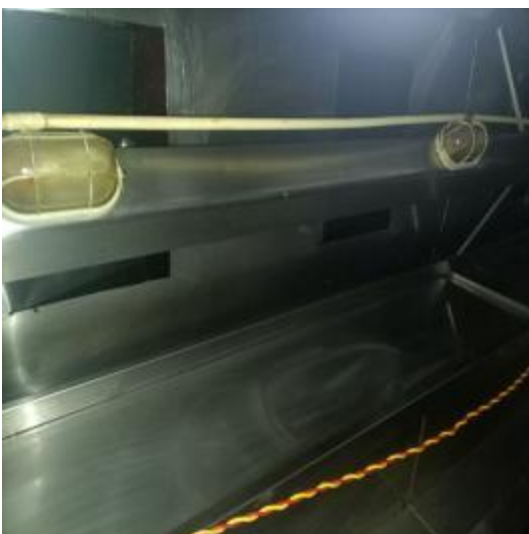
烧腊房烟罩清洗后