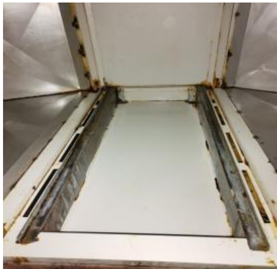
净化器机箱清洗后