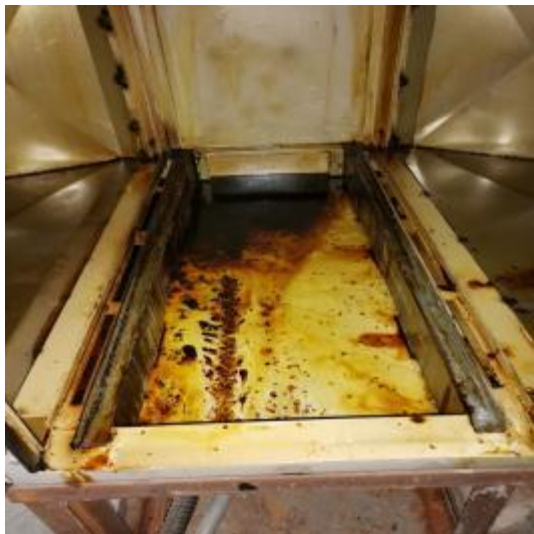
净化器机箱清洗前