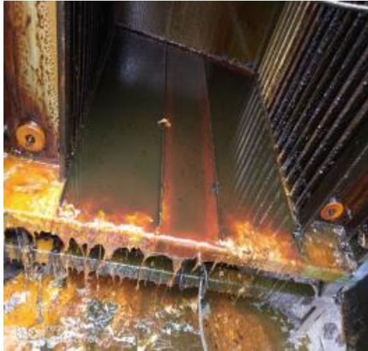
净化器内部清洗前