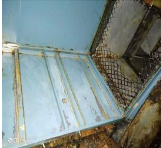
净化器内部清洗后