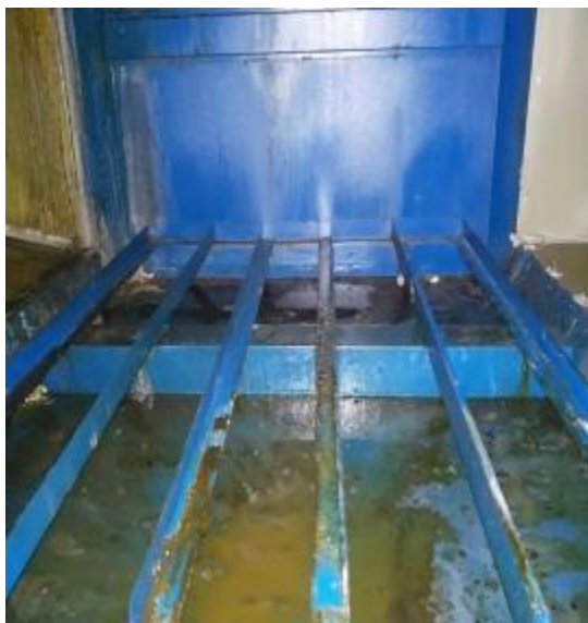
净化器内部清洗前