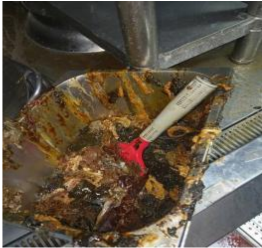
净化器内部清洗后