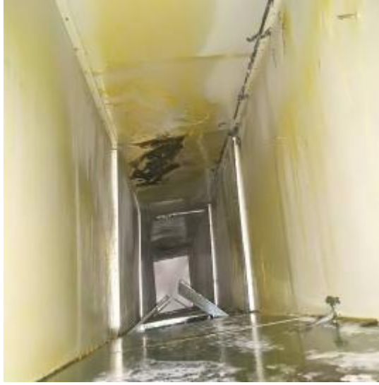
1 管道清洗前 1