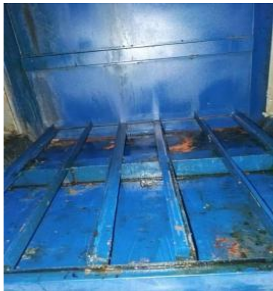
净化器内部清洗后