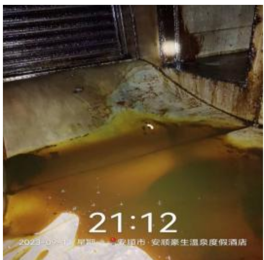
中厨房管道清洗前