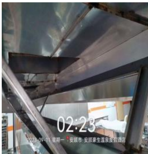
中厨房烟罩清洗后