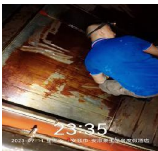
中厨房管道清洗中