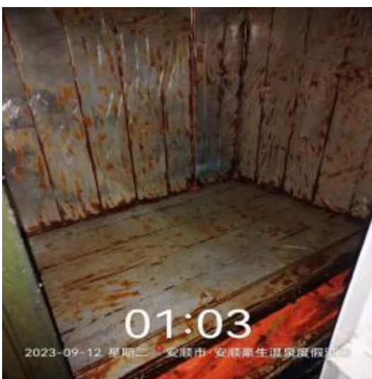
中工厨房管道清洗后