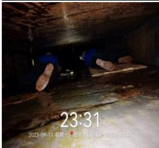
中厨房管道清洗中