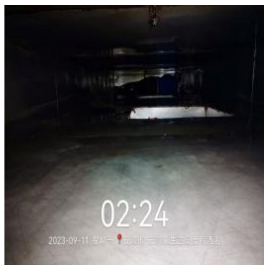
中厨房防火板清洗后