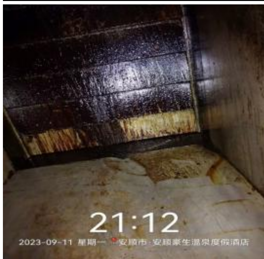
中厨房管道清洗前