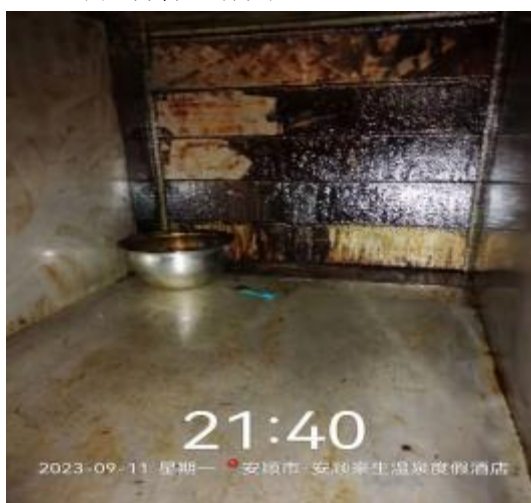
中厨房管道清洗中