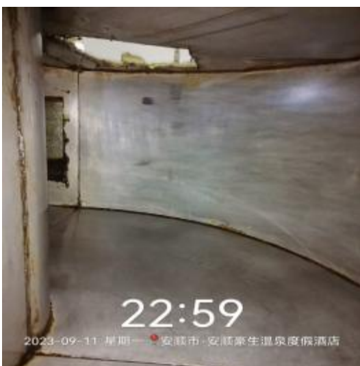
中工厨房管道清洗后