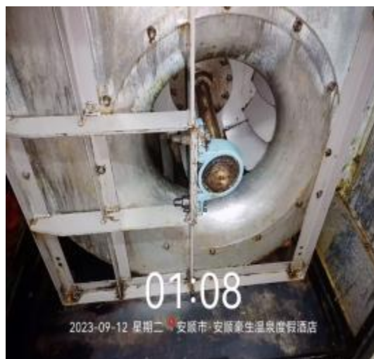
中厨房净化器机箱清洗后