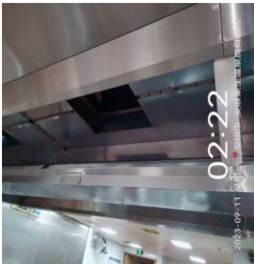
中厨房烟罩清洗后