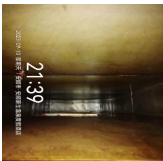
中厨房防火板清洗前