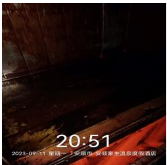
中厨房管道清洗前