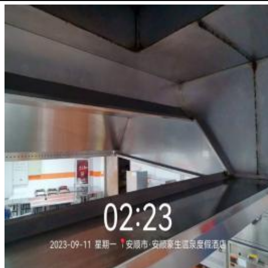
中厨房烟罩清洗后