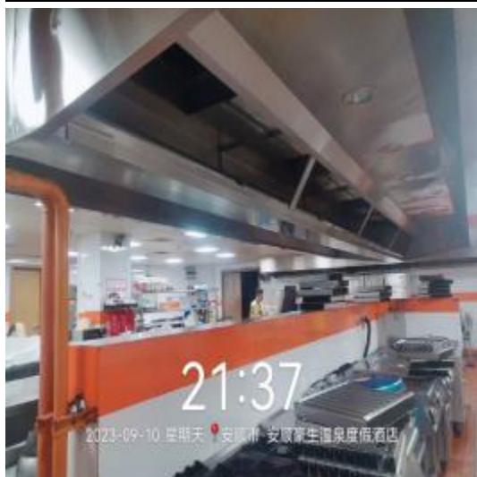
中厨房烟罩清洗前