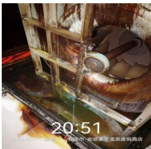
中厨房净化器机箱清洗前