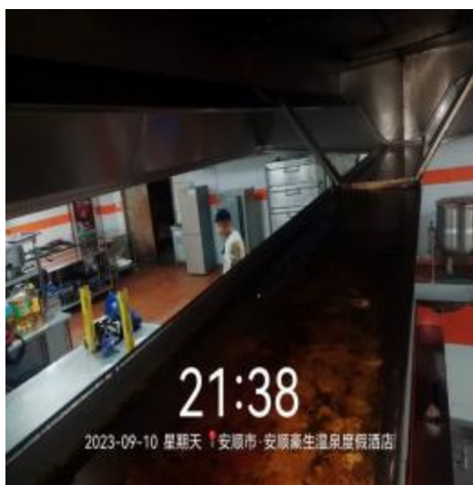
中厨房烟罩清洗前