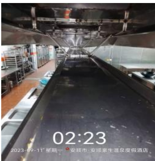
中厨房烟罩清洗后