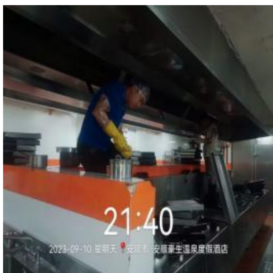
中厨房烟罩清洗中