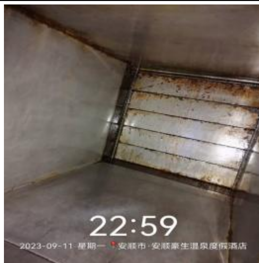
中工厨房管道清洗后