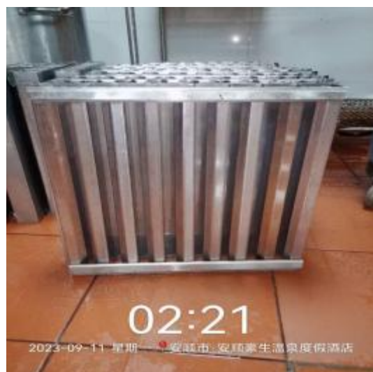
中厨房防火板清洗后