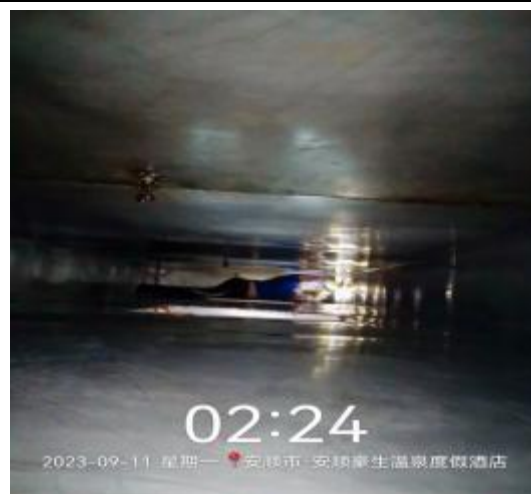
中厨房管道清洗后