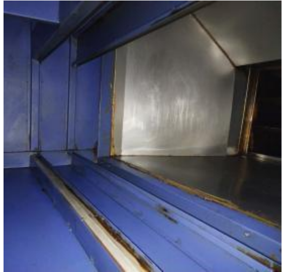
一楼净化器内部清洗后