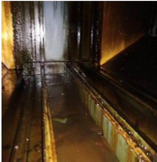
一楼净化器内部清洗前