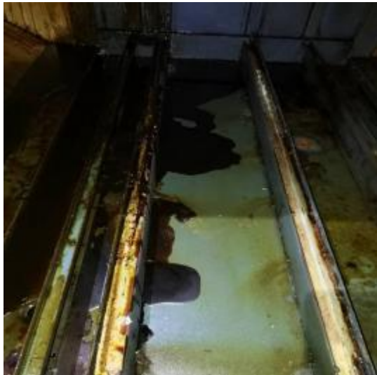
净化器内部清洗前