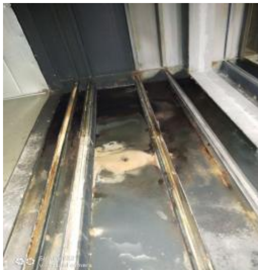
净化器机箱清洗前