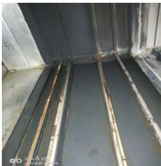
净化器机箱清洗后