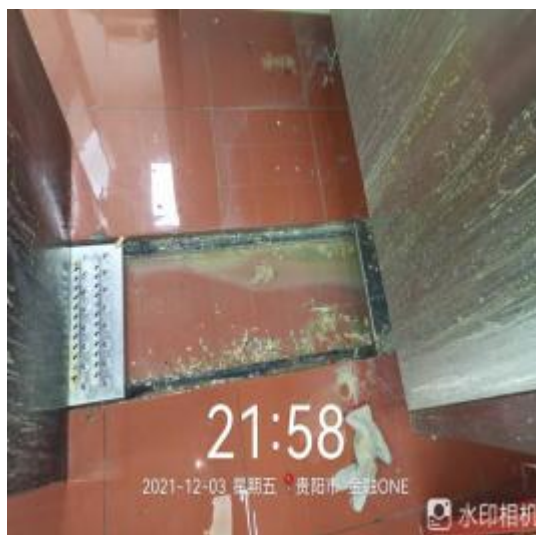
厨房地面卫生清洗中