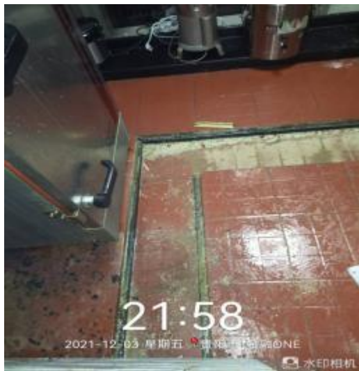
厨房地面卫生清洗前