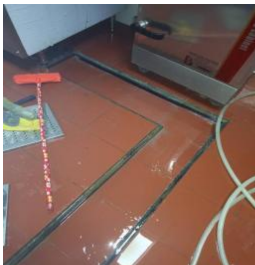
厨房地面卫生清洗中