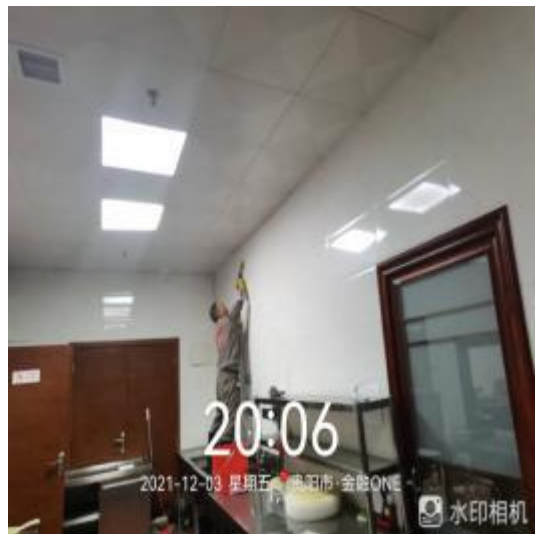
厨房墙面卫生清洗中