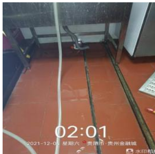
厨房地面卫生清洗中