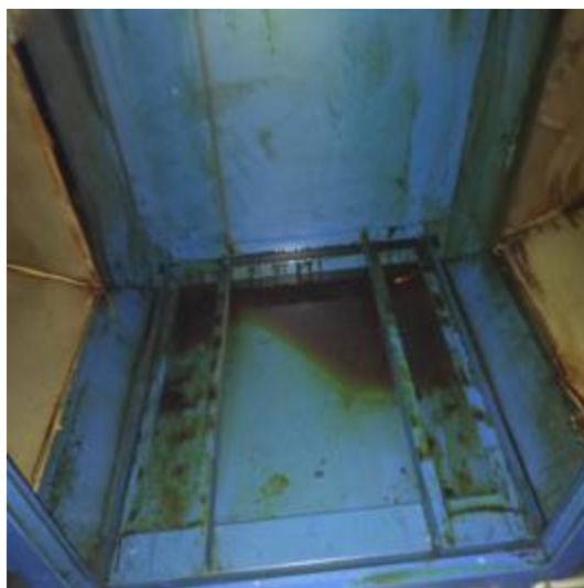
净化器机箱清洗前