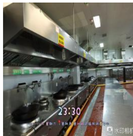
2楼整体烟罩清洗后