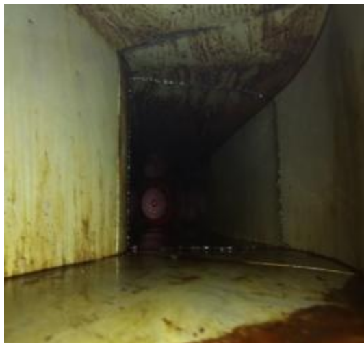
横向管道风机清洗前