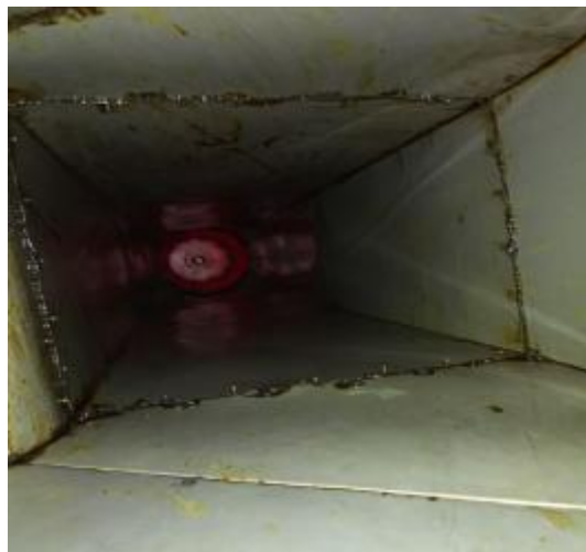
横向管道风机清洗后