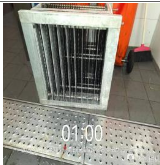
净化器机箱清洗后