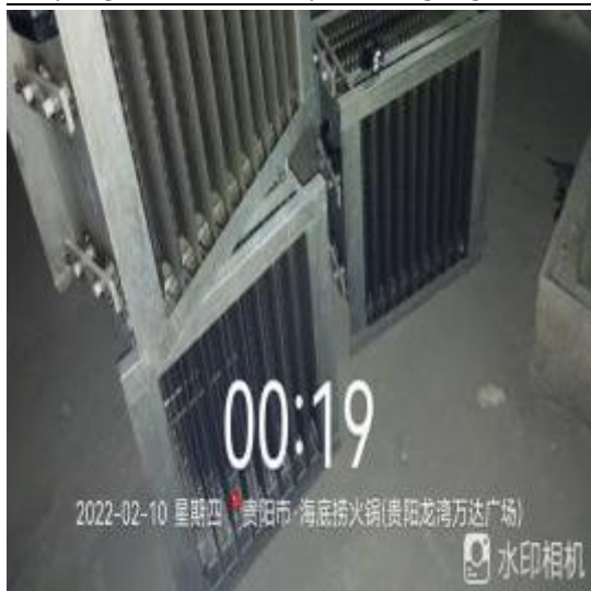
净化器机箱清洗前