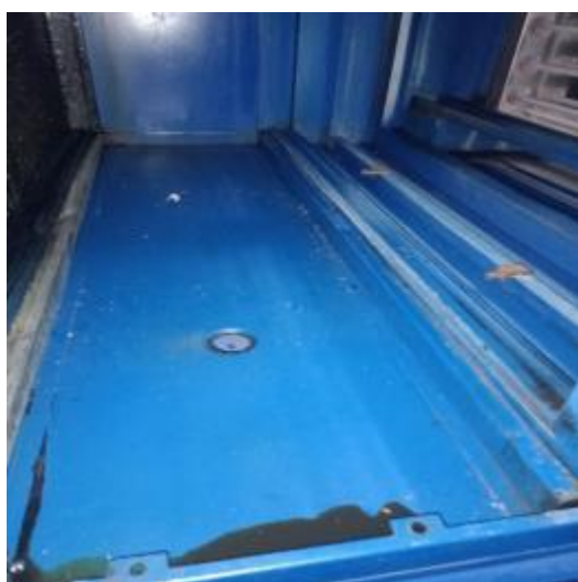
净化器机箱清洗前 2