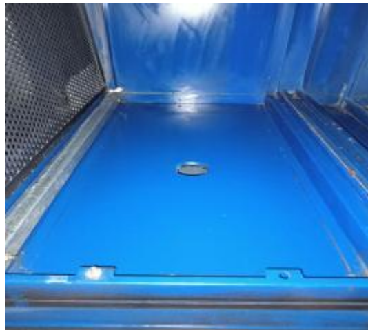
净化器机箱清洗后 1