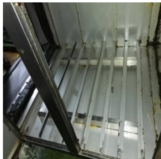
净化器机箱清洗后