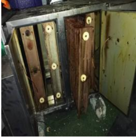
净化器机箱施工中