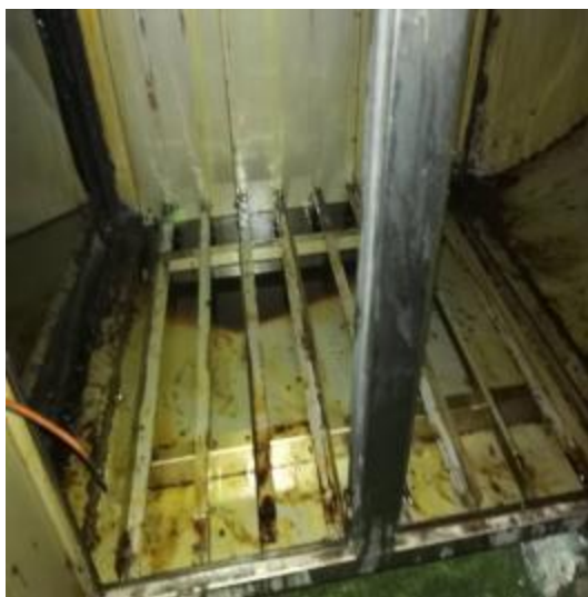
净化器机箱清洗前