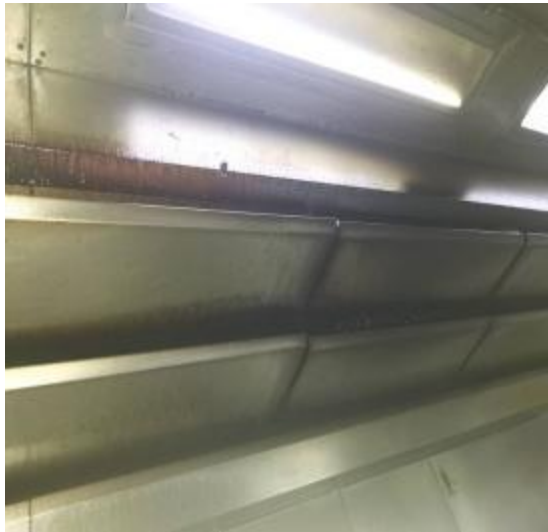
中厨房烟罩清洗前