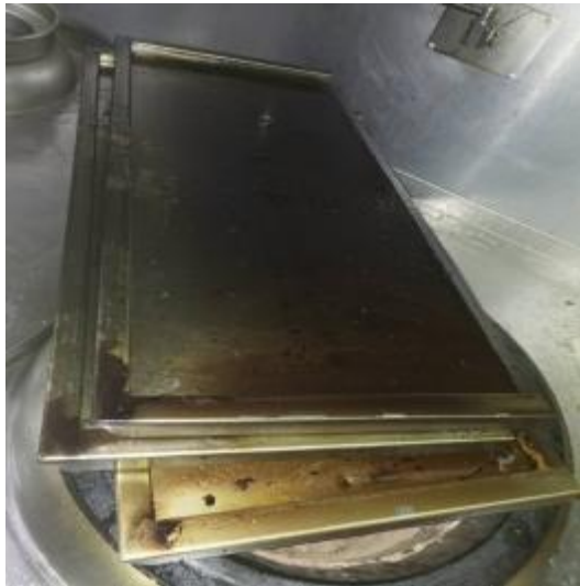
中厨房防火板清洗前