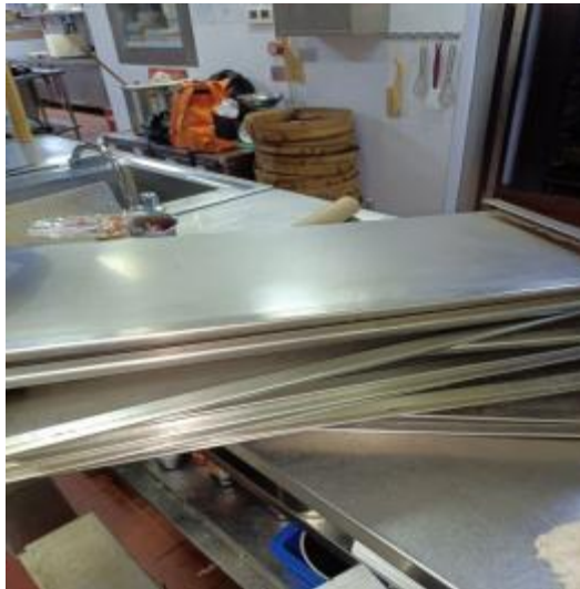
北楼防火板清洗前