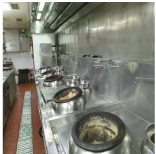
中厨整体房烟罩清后