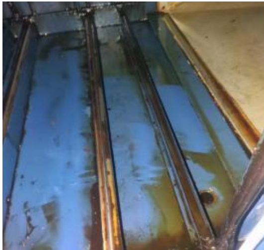
净化器机箱清洗前