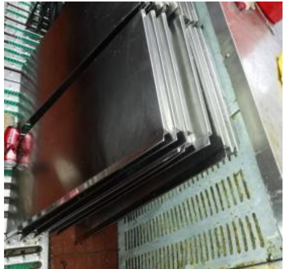
中厨房防火板清洗后