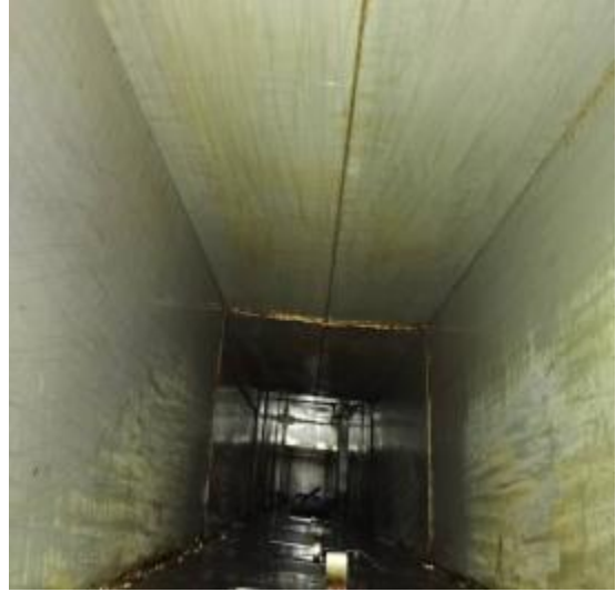
中厨房管道清洗后