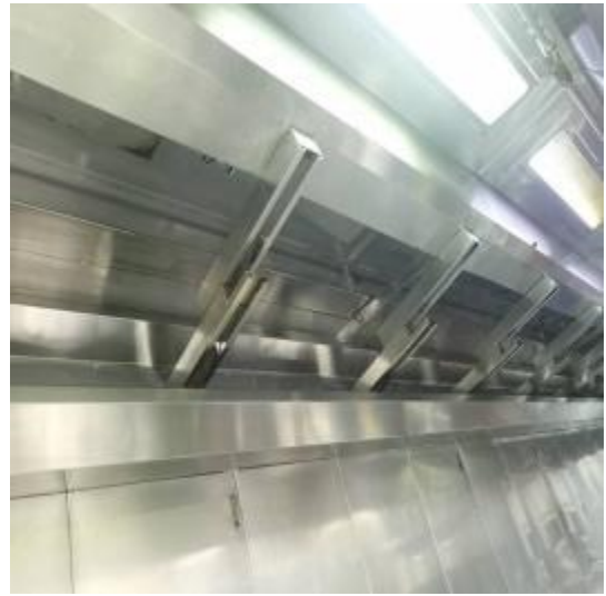
中厨房烟罩清洗后