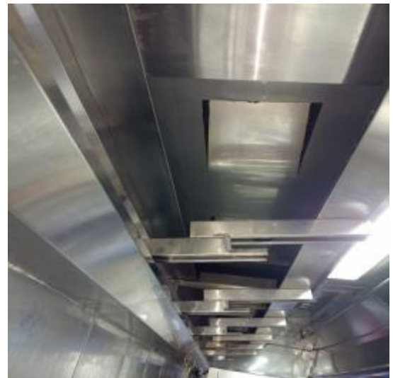
北楼厨房烟罩清洗后