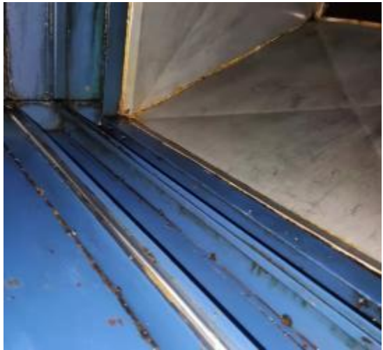
净化器机箱施工中