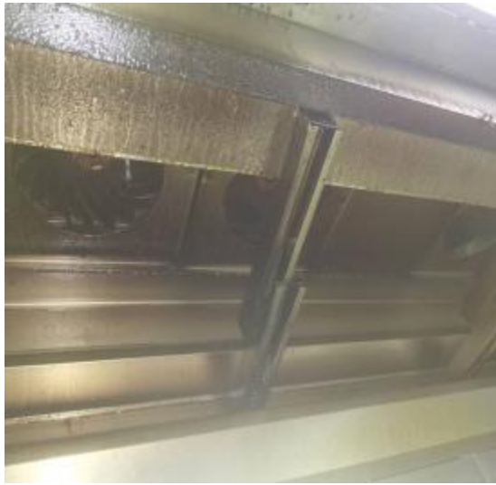
中厨房烟罩清洗前