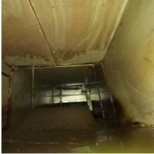
中厨房管道清洗前