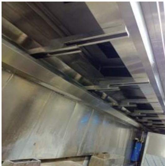
北楼厨房烟罩清洗前