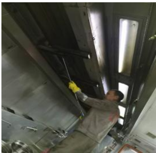
中厨房烟罩清洗中