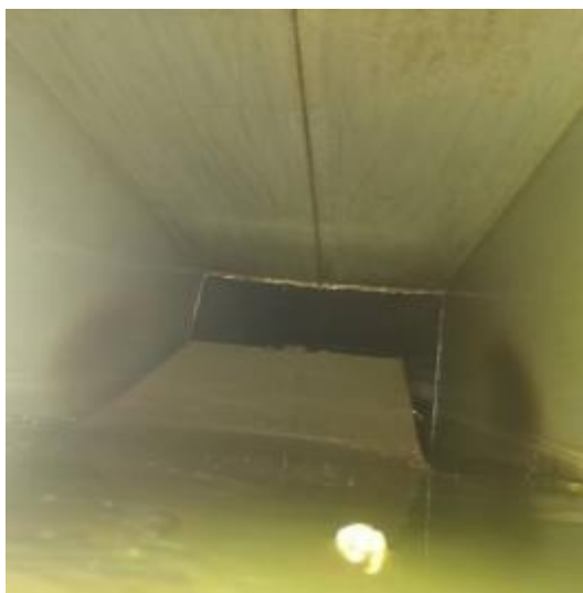
中厨房管道清洗前