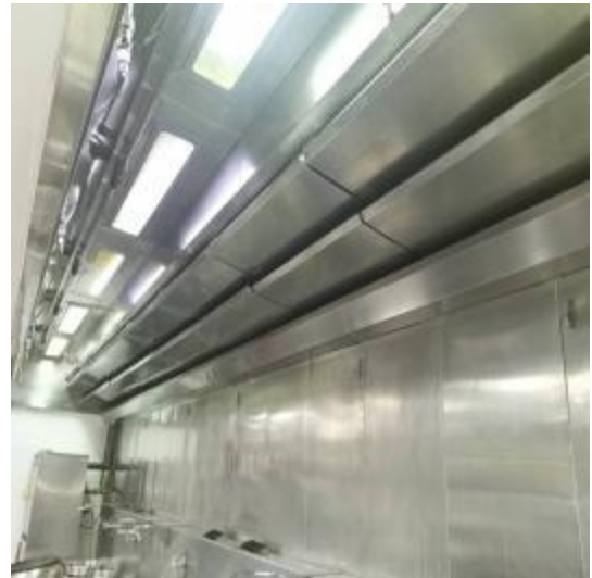
中厨房烟罩清洗后