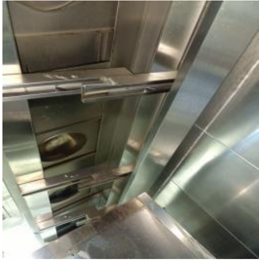
北楼厨房烟罩清洗前