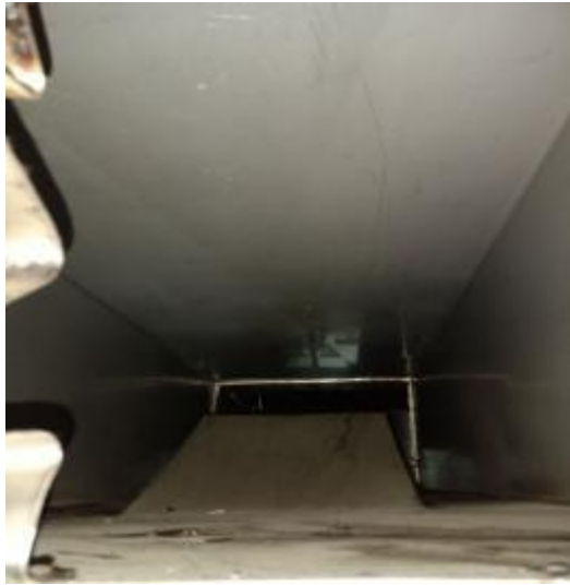
北楼厨房管道清洗前