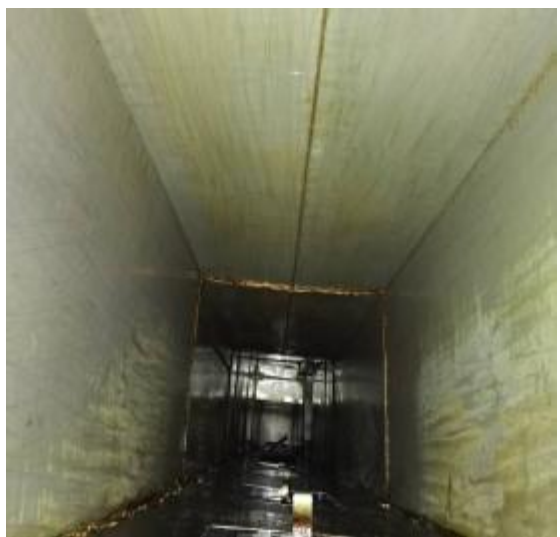
中厨房管道清洗后