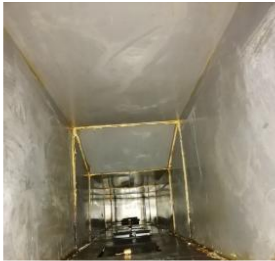
北楼厨房管道清洗后