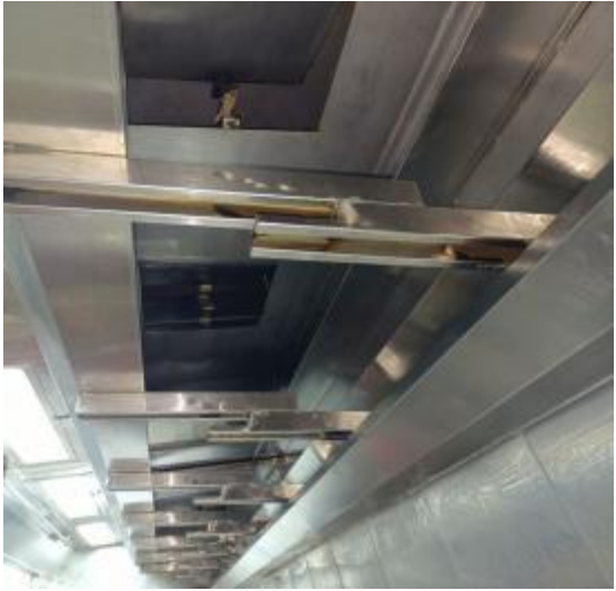
北楼厨房烟罩清洗后