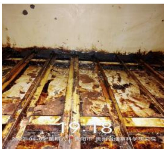
净化器机箱清洗后