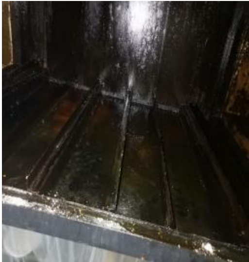
净化器机箱清洗前