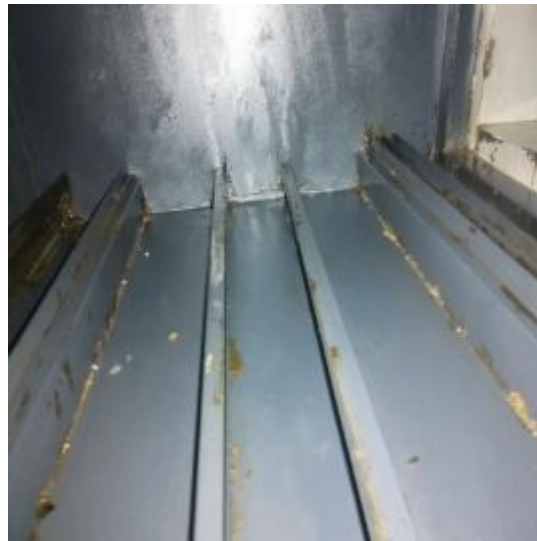
净化器机箱清洗后